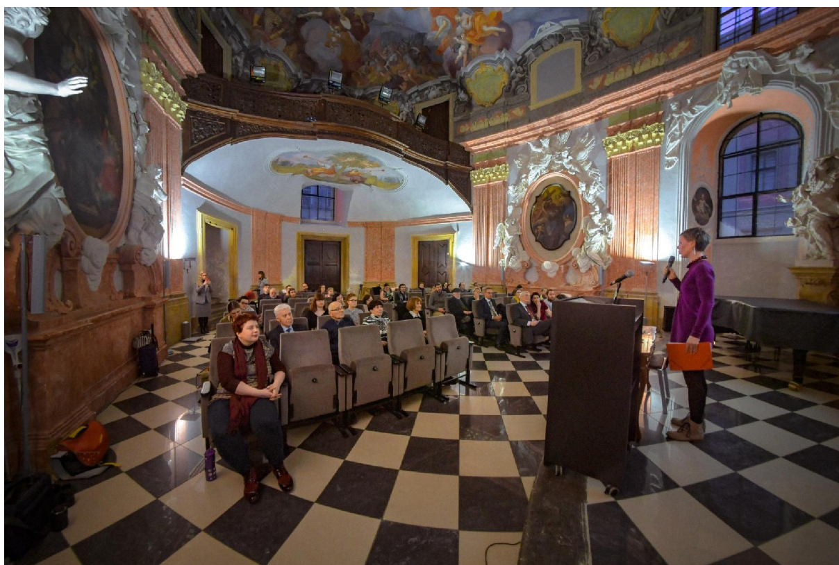
17. února 2020